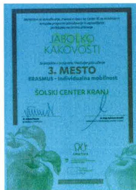
Nacionalna nagrada za primer dobre prakse izvajanja projekta izmenjav na VSŠ ŠC Kranj (december 2016)

Na področju izmenjav smo si zadali visoke cilje, tako v smislu povečanja števila izmenjav kot tudi kvalitete njihovega izvajanja. Zavedamo se pomembnosti stalnih izboljšav tudi